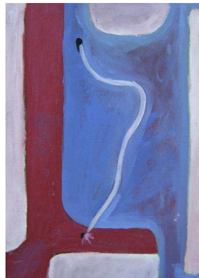
William Joseph acrylique 50 x 70 cm