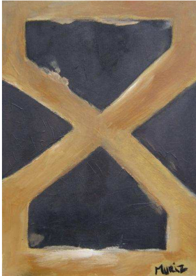
Osmanovic Muriz acrylique et matière 50 x 70 cm