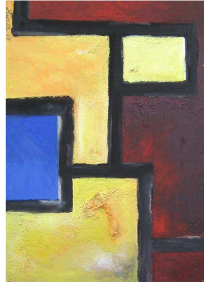
Osmanovic Muriz acrylique 50 x 70 cm