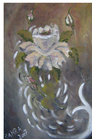
Kamaln Ardakany Zahra acrylique 50 x 70 cm