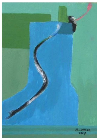
Al Wailaie Majed acrylique 50 x 70 cm

Les élèves on tous travaillé sur un support en bois de 50 x 70 cm