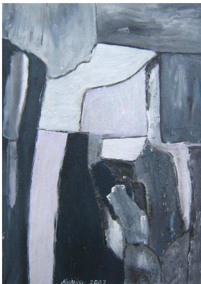
Mujcinovic Muhiba acrylique et matière 50 x 70 cm