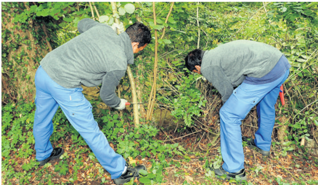
Deux requérants œuvrent sur un chantier d'utilité publique, à Vich. GEORGES MEYRAT

Hormis l'aspect policier, l'encadrement est assuré par un groupe de suivi, mis en place dès la réquisition de l'abri. Il réunit en séance mensuelle des représentants de la Municipalité, de l'Etablissement vaudois d'accueil des migrants (EVAM), de la