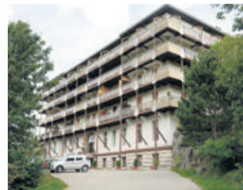
Le retour d'un hôtel sur cette parcelle de Saint-Cergue est peu probable. GEORGES MEYRAT

Un différend oppose la commune de Saint-Cergue à la fondation qui avait acquis la colline surplombant le village en vue d'y réaliser un établissement de luxe