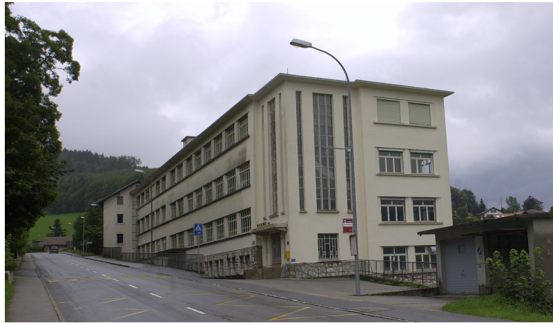
Le bâtiment va être vendu, à un acheteur encore anonyme.