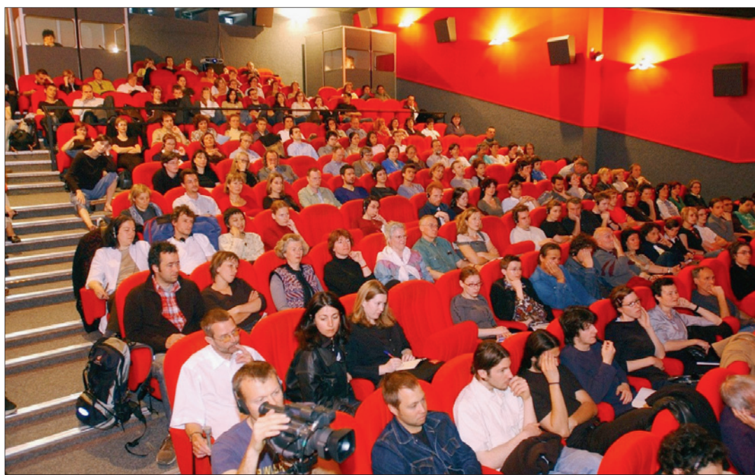
Le groupe qui reprend le cinéma estime que le Capitole a un vrai potentiel de développement. Dans le cadre des premiers investissements figure le changement des fauteuils.