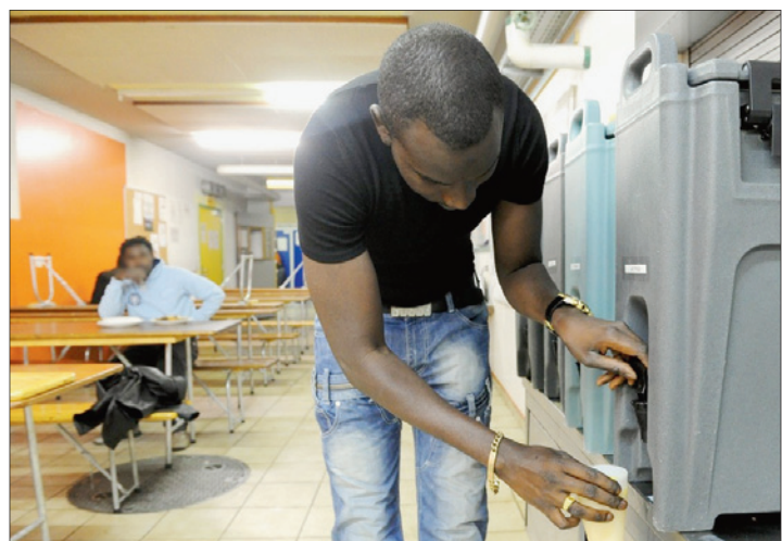
L'abri PC n'accueillera plus de requérants au-delà du 31 janvier 2012. La Municipalité exigeait sa fermeture au 31 janvier 2011.

Dans un communiqué commun, la Municipalité et l'Etablissement vaudois d'accueil des migrants ont annoncé, jeudi, que l'abri PC fermera au plus tard le 31 janvier 2012. On se souvient que le 31 janvier dernier, les élus et le Canton avaient passé un accord, notamment quant au nombre de personnes hébergées. D'ici au 1 er mars, de 130, elles passeront à 80. Deuxième point: le renforcement des mesures d'accompagnement pour lutter contre le désespoir des demandeurs d'asile. Lundi 14 février, les représen-