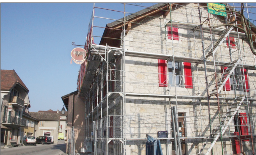
De lourds travaux ont été effectués au Bœuf Rouge, à Crassier. La cuisine a été déplacée et agrandie, notamment. Céline Reuille

Le 28 mai auront lieu à Nyon les assises vaudoises de l'immigration. A cette occasion sera remis le prix du Milieu du Monde organisé par la Chambre cantonale consultative des immigrés. Ce prix récompense des collectivités ou des personnes privées qui se sont illustrées pour une meilleure compréhension entre les Vaudois et les personnes étrangères. Les candidatures pour ce prix peuvent être déposées jusqu'au 31 mars. Toutes les informations sur www.vd.ch/integration