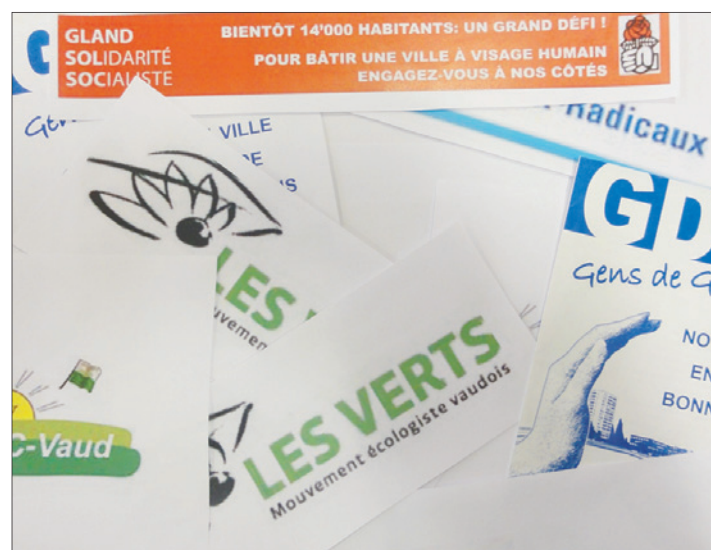
Le PS et les Verts se sont apparentés pour le Conseil communal. Pour la Municipalité, rien ne lie les deux partis. RH