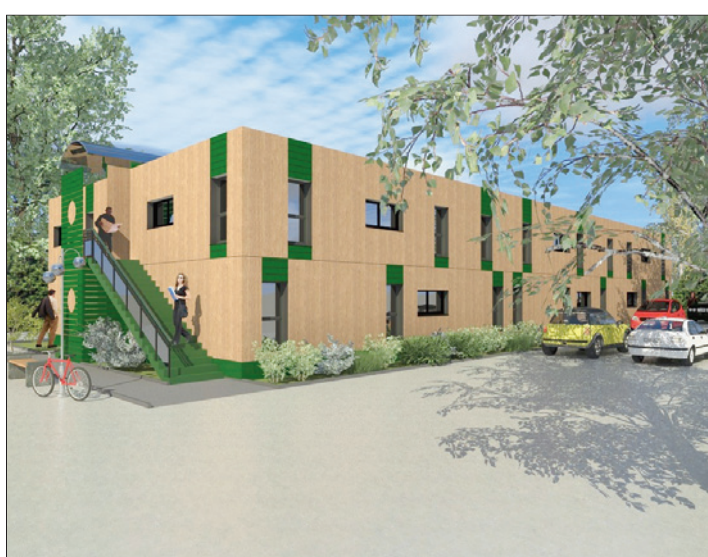
Nouvel épisode : les pavillons provisoires voulus par la fondation Esp'Asse sont désormais au centre d'une pétition.