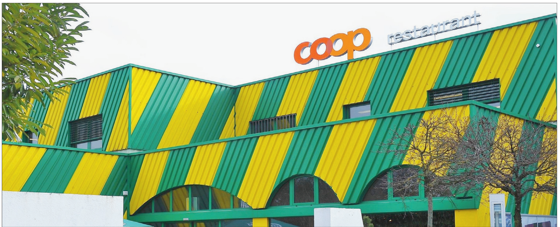
Le nouveau complexe occupera toute la parcelle. Le bâtiment de l'actuelle Coop est vétuste, il avait été construit en son temps pour le magasin Waro, qui a disparu depuis lors. De nouveaux commerces s'y installeront et dynamiseront la zone. Tatiana Huf et Emeg

est prévu dans le plan de quartier. Une tour de quatre niveaux destinée à de l'administratif sera également implantée sur le site. Trois parkings en sous-sol offriront quelque 650 places. La semaine nous entendons mettre à disposition un P&R, voire pour des manifestations car toutes les places ne seront pas occupées. Deux niveaux sortiront de terre avec à hauteur de la toiture un tiers de niveau prévu pour du tertiaire. L'étage inférieur abritera des bouti-