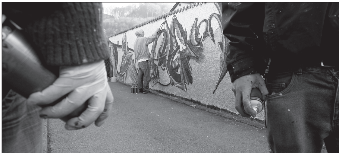
Skor, Salem et Meyk lors de la réalisation de leur œuvre